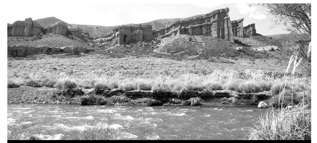
Castillos de Pincheira un lugar ideal para el descanso.