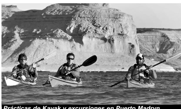
Prácticas de Kayak y excursiones en Puerto Madryn.

Coches con servicio completo a bordo, desayuno, almuerzo, merienda y cena $759. Dos salidas diarias, la primera a las 8 horas llega a Puerto Madryn a las 15,30 horas. Segunda salida 22,20 horas, llega a las 17,40 horas a Puerto Madryn.